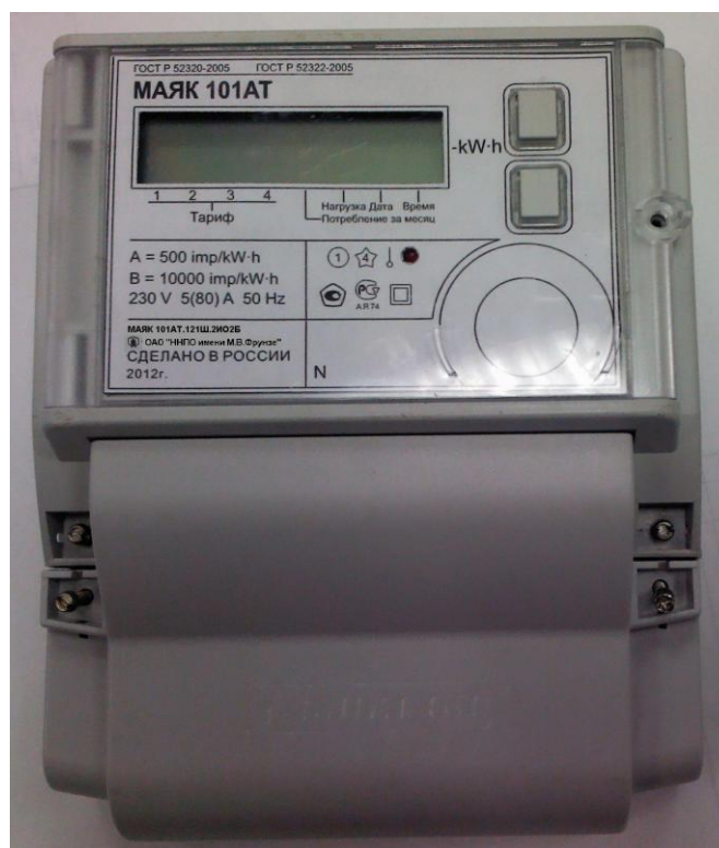
Рисунок 1 – Внешний вид счетчика с закрытой клеммной крышкой

Внешний вид счетчика МАЯК 101АТ с закрытой клеммной крышкой приведен на рисунке 1.