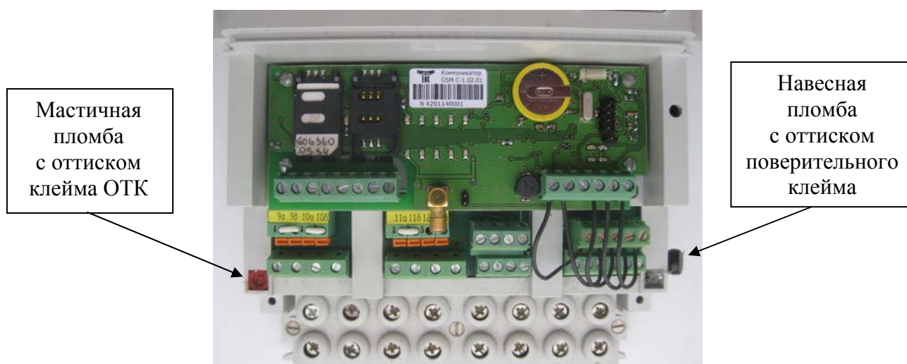
Рисунок 3 - Внешний вид счетчика внутренней установки со снятой крышкой зажимов