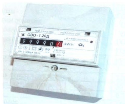
Рисунок 1 – Внешний вид счетчика СЭО-1.20Д

6 Внешний вид и схема пломбирования Внешний вид счетчиков СЭО-1.20Д с закрытой клеммной крышкой и схема опломбирования приведены на рисунках 1, 2.